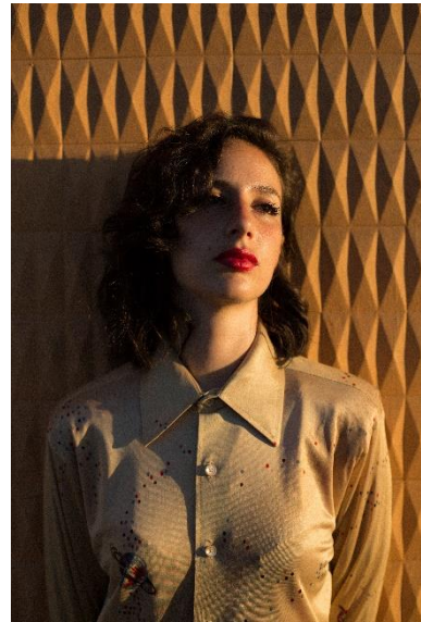
Tania Franco Klein

Le fotografie di Tania Franco Klein si distinguono per l'originalità della messa in scena. Parlando della sua attuale mostra intitolata Proceed to the Route , le cui fotografie sono tutte stampate su carta Canson® Infinity, Tania ha commentato: "Con questo progetto ho cercato di generare nell'osservatore un senso di isolamento, di disperazione e di ansia attraverso frammenti di immagini che esistono sia in forme reali che fittizie. Sono sensazioni di cui ho avuto la prova solo quando le mie opere sono state stampate. Ho sempre concepito il mio lavoro come incompleto prima della stampa, perché è su carta che le immagini prendono vita e solo allora le persone possono apprezzarle" .