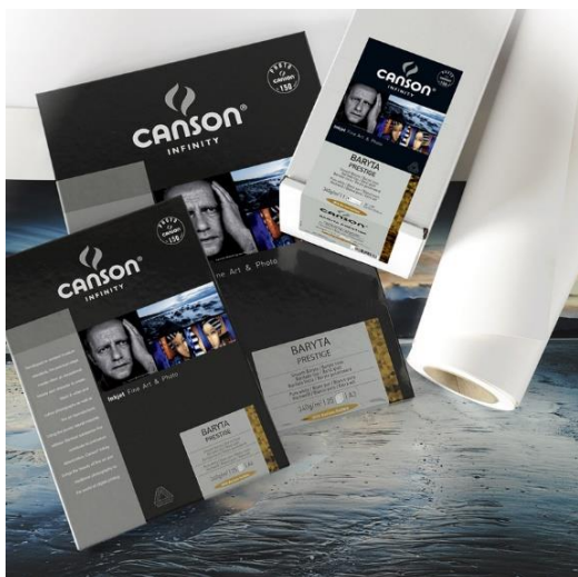
Canson® Infinity Baryta Prestige