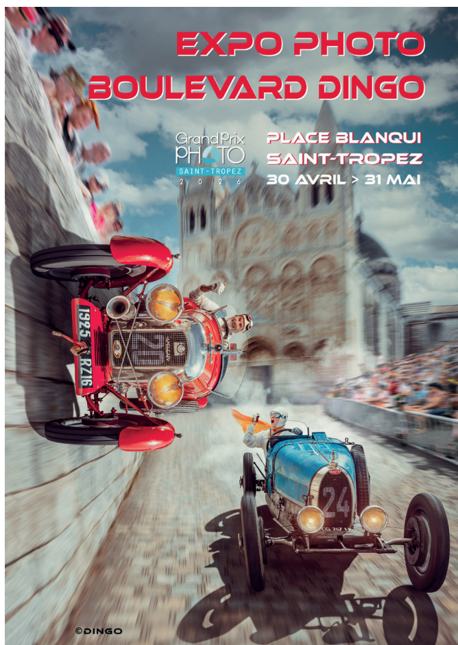
Photo extraite des affiches du Circuit des remparts d'Angoulême

Du 30 avril au 31 mai 2026 - Place Blanqui - Saint-Tropez