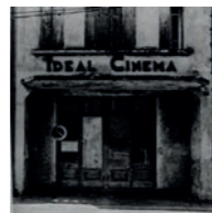
Francois VIGNES DEVANTURES À L'ABANDON

Formée aux métiers de la photographie en 1993, elle s'investit dans le milieu associatif et par ce biais propose des ateliers photographiques tous publics. Parallèlement ses voyages donnent lieu à plusieurs expositions : l'Inde, le Maroc, la Grèce, la Turquie ainsi qu'un livre paru en 2005 aux éditions Cris écrits Marseille. Aujourd'hui factrice sur le canton de Yenne, sa passion pour la photographie l'accompagne dans ses tournées.