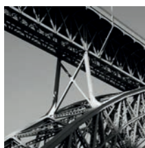
Maloupictures ALPHABET URBAIN [des lettres dans la ville]

Depuis une vingtaine d'années, je vadrouille en Corse, ma seconde terre d'accueil, pour révéler ses beautés inépuisables. Mes photos paraissent surtout dans la presse-magazine, Alpes, Destination Corse, Terre Sauvage, Arbres et Forêts, Trek, et l'édition, Gallimard, Dakota, etc. Depuis une quinzaine d'années, j'écris les textes de mes reportages, essentiellement consacrés à la découverte des sites naturels, par la marche. Découvrez ses images sur www.pierre-huchette.com