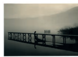
Angelo di Mango LE LAC D'AIGUEBELETTE EN HIVER

Technique argentique, papier baryté et virage thio-urée.