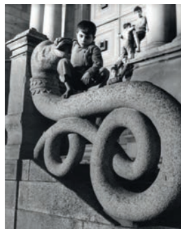
Jean Dieuzaide LA PHOTOGRAPHIE COMME SACERDOCE

Que Jean Dieuzaide soit un homme du Sud, nul ne peut le contester. Sa naissance à Grenade-sur-Garonne en 1921, son enfance dans le Gers puis sur la Méditerranée, et son attachement indéfectible à Toulouse qu'il fit première ville de France dotée d'une galerie de photographie, ne peuvent que confirmer ce fait. Probablement qu'un exil à Paris aurait donné à lui-même et à son œuvre, une aura à l'égale des Doisneau, Boubat, Ronis ou Cartier Bresson. Mais son choix de défendre, et ses origines et sa profession, eut raison d'une velléité qui l'a effleuré, sans jamais parvenir à entamer sa détermination de travailler et se battre depuis sa terre occitane.