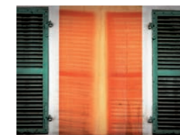
Jean-Charles Bouillot ITINÉRAIRE

Ce sont près de 80 photographes qui ont participé à la création de cette forêt en proposant leur arbre ou interprétation de la forêt. Forêt remarquable par sa composition et par le nombre de ses créateurs - Incontournable.