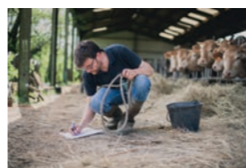
Eve HILAIRE TOUS EN BOTTES

L'art est une succession de choix et mes tableaux sont des aventures incertaines, conçus dans la spontanéité « guidée » de l'instant, en quête d'énergie graphique, de dynamique des formes, de force des perspectives, d'impact et d'équilibre des couleurs.